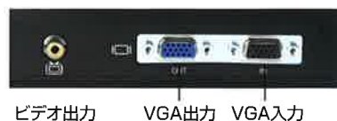
ビデオ出力 VGA出力 VGA入力