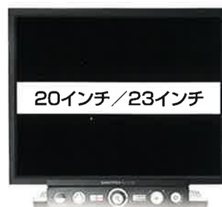
※画面はハメコミ合成したものです。